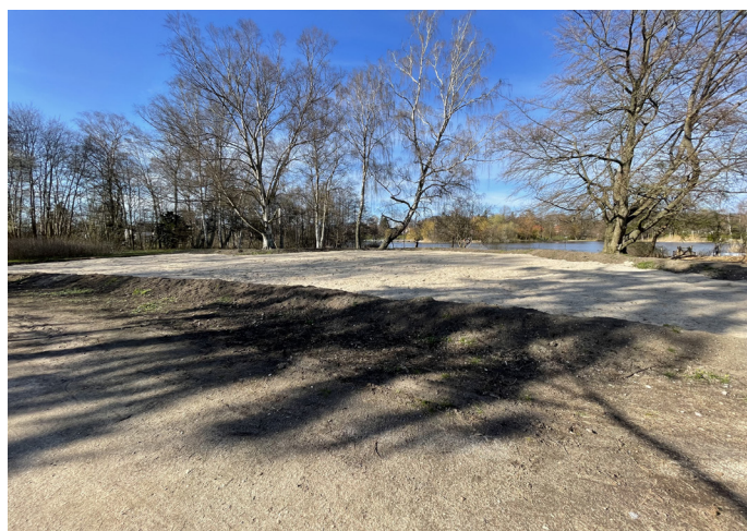
Figur 4. Sådan så biodiversitetsområdet ud i Påsken.