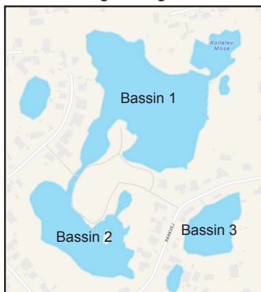
Figur 2. Oversigtskort over Kollelev Mose med angivelse af bassinnumre.

Det kommende biodiversitetsområde er nu så langt fremme, at der er tilført et næringsfattigt sandlag som vækstmedie for udplantning af de 28 forskellige danske blomsterarter, som der står på informationsskiltene opsat på stedet, se figur 4 og 5.