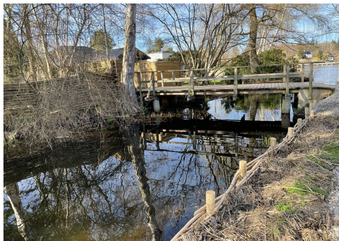
Figur 3. Billede af den oprensede kanal mellem Bassin 1 og 2. Pileflettet ses langs den højre brink.