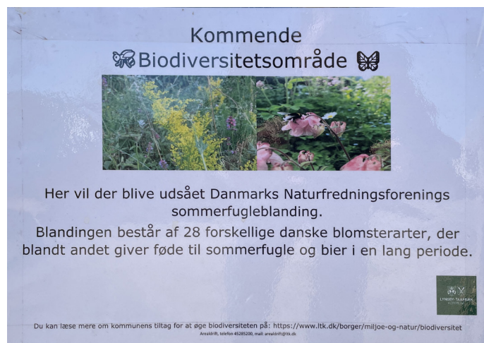
Figur 5. Informationsskilt opsat ved pladsen, der forklarer, hvorfor tinge lige nu ser ud som de gør, og hvad der er i vente.